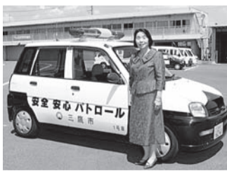
安全安心パトロールカーの前で

ご近所やお知り合いの方でこの頃姿を見なくなったなど、安否が心配だという時には、この電話にお知らせください。状況に応じて、市の関係部署が連携し、調査し対応します。従来から民生・児童委員、地域包括支援センター等と連携してきましたが、今後は、電力、ガス、金融機関等の事業者や団体の皆様と協定を結び、「見守りネットワーク」を拡充していきます。緊急時は、警察署や消防署と連携しながら、市の「見守りネットワーク」担当部長が救出の判断をします。孤立死を防ぎ、安全に安心して暮らせる見守りネットワークづくりに皆様のご協力をお願いします。