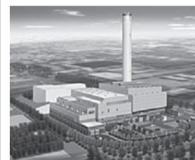
新ごみ処理施設完成イメージ