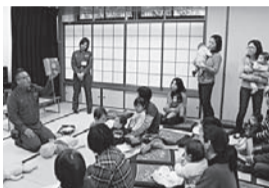
地域ケアネットワークの頭