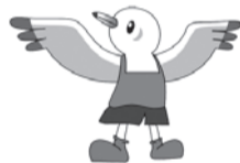
東京国体のマスコット「ゆりーと」