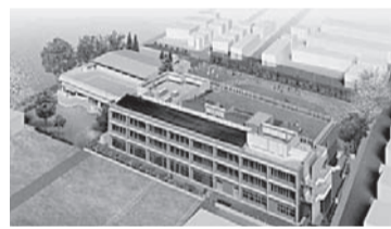
第三小学校校舎建て替え後のイメージ