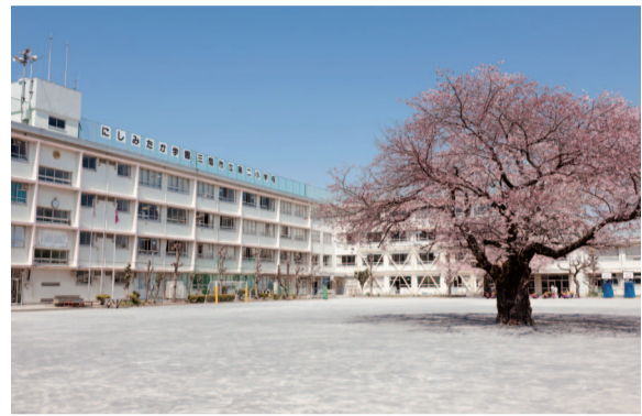
にしみたか学園第二小学校