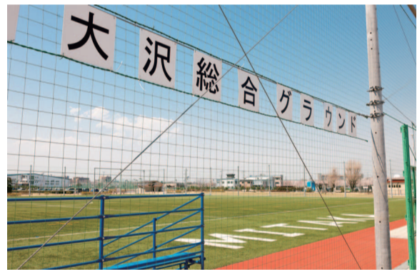
武蔵野の森公園大沢総合グラウンド