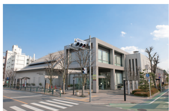
芸術文化センター