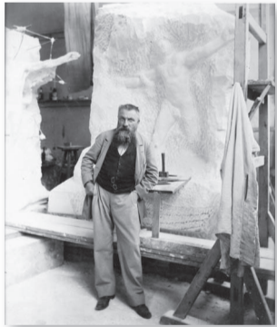
オーギュスト・ロダン 1898年7月20日、サルミエントの記念碑の前で