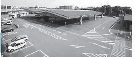
現在の三鷹市暫定管理地 (東京多摩青果(株)三鷹市場跡地)