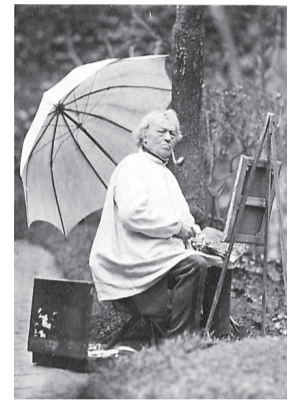
カミュー・コロ 1871-1872年

日本でも人気の高い19世紀フランス絵画ですが、それらの作品を生み出した芸術家たちの容姿を知る人は少ないでしょう。本展では画家アングル、ドラクロワ、コロ、ドーミエ、セザンヌ、ルノワール、モネ、ルソー、マティス、女優サラ・ベルナール、詩人ボードレールなど40人の芸術家の制作風景や日常なども垣間見ることのできる貴重な写真100点を展示します。