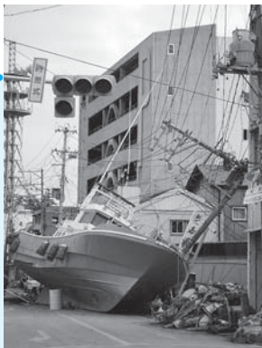
宮城県石巻市で撮影

問東京都水道局多摩お客さまセンター ☎0570-091-101、三鷹市下水道課 ☎内線2872