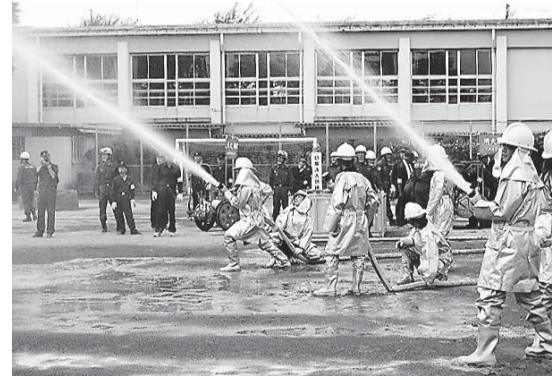
防災訓練での活動

地域の防災力を高めるには、自分の身を守る「自助」と地域で協力し合う「共助」の方法を身に付け向上することが不可欠です。地域の自主防災組織に積極的に参加し、いざという時に備えましょう。興味のある方は下記の各事務局へお問い合わせください。