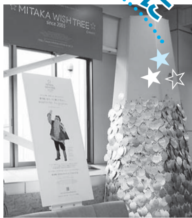
昨年のウィッシュツリーの様子