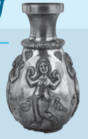
「鍍金銀製女神文水注 5～7世紀イラン」

シルクロードを通して日本にも伝わったイランの銀器やガラスの美しさを紹介。同館の所蔵品だけでなく、岡山市立オリент美術館や東京大学の美術・工芸品も展示。また、ペルシア文化が奈良時代や高度経済成長期の日本文化に与えた影響を考えながら、「日本人にとってのオリент、ペルシアとは何だったのか」をひもときます。 ④平成23年2月27日(日)までの午前10時～午後5時(入館は4時30分まで)月・木曜日休館(祝日は開館、振替休日なし) ※12月25日(土)～平成23年1月6日(木)は休館。 ¥三鷹・武蔵野市民100円(住所が確認できるものを持参)、一般800円、高校・大学生500円、65歳以上400円、中学生以下無料、団体15人以上200円割引 ④期間中会場へ ④同館 ☎32-7111