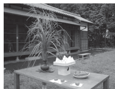
中秋の名月お月見会

⑩9月23日(祝)昼の部「ジュニアスタッフの模擬店、お話し会」=午後3時~5時、夜の部「星空観望会」=午後6時~8時(夜の部は雨天中止)