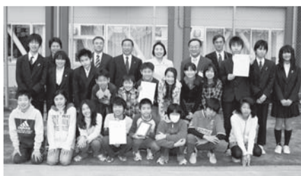
市長賞を受賞した東三鷹学園(一小・北野小・六中)の児童・生徒