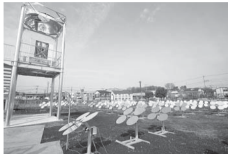
大型楕円鏡を囲む70台の太陽追尾型ヘリオスタット

※この実験による騒音・振動・臭気・光の乱反射などは発生しません。 ☎企画経営室 ☎内線2114