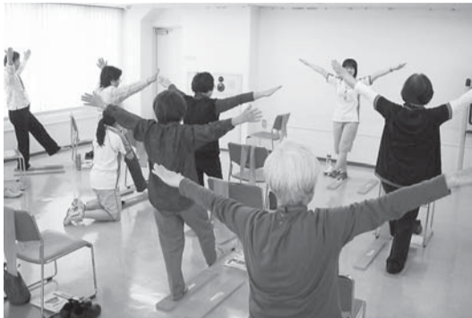
介護予防教室の一例