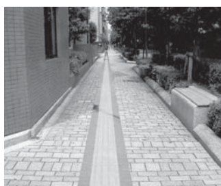
「風の散歩道」の整備後のイメージ