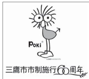
市制施行60周年記念事業の統一ロゴマーク