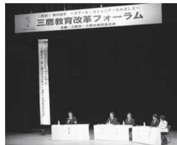
三鷹教育改革フォーラム