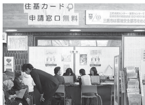
市役所1階の住基カード特設申請窓口