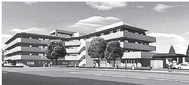
みたか紫水園(仮称)の整備後のイメージ