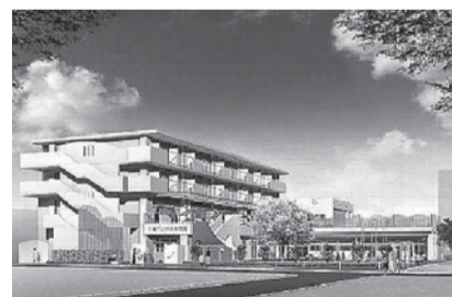
中央保育園と母子生活支援施設三鷹寮の建て替え後のイメージ