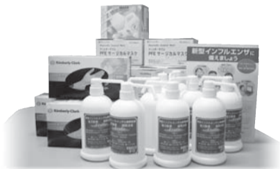
新型インフルエンザ対策備蓄品