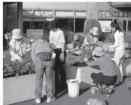
「花と緑のまちづくり」の取り組み