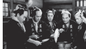
第七部 初祝い清水港