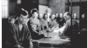
第八部 海道一の暴れん坊 東京国立近代美術館フィルムセンター所蔵作品(予定)