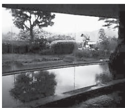
自慢の源泉掛け流し温泉