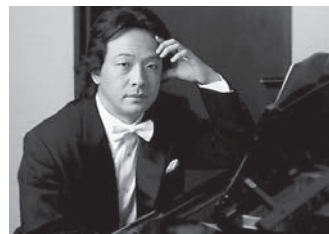
沼尻 竜典

※公演とは別にチケットが必要です。 人 友の会会員、または在勤・在学を含む市民40人 ￥1,000円 申 電話予約のみ。1人2枚まで。本公演にご来場の方限定