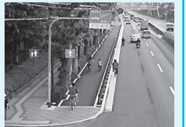
三鷹通り～武蔵境通り(モデル区間)の南側歩道(都営深大寺東町八丁目アパート付近)