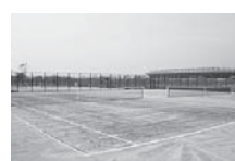
大沢総合グラウンド テニスコート