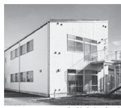
七小小学童保育所