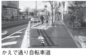
かえで通り自転車道