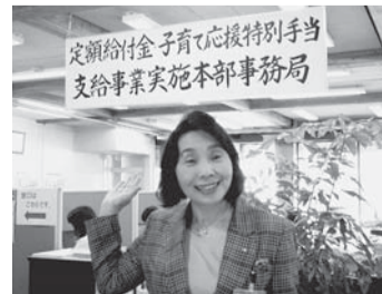
市役所2階の実施本部の窓口で