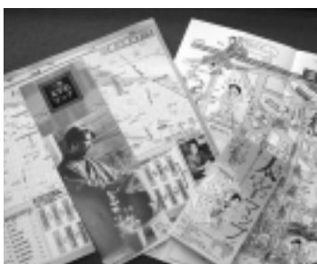
「元祖・太宰マップ(右)」と「三鷹太宰マップ(左)」

みたか太宰の会の「元祖・太宰マップ」がリニューアル 個性的なイラストで太宰治の三鷹時代を案内する絵地図と太宰治にまつわるコラムで構成され、三鷹の文学散歩の道案内として長く親しまれてきた、みたか太宰の会の「太宰マップ」が、昨年12月にリニューアルされました。マップの初版が発行されたのは1994年の桜桃忌のこと。A3判の紙全体に描かれた手書きのイラストと文字が印象的なマップでした。内容はどれも長きに渡り市民目線で太宰を研究してきた同会が実際に聞き書きをしたものなどで、太宰ゆかりの三鷹を訪れる人たちに無料で配られ、文学散歩の案内役を果たしてきました。今回