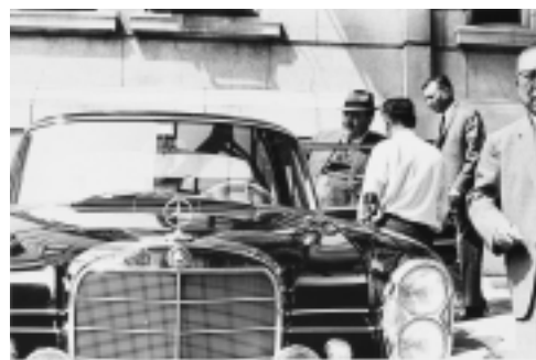
関口正夫「ことより」

三鷹市美術ギャラリーで2004年度に開催した《牛腸茂雄展》では、1960年代後半から80年代前半の日本を、スナップ写真という形で自己に即して捉えた写真家・牛腸茂雄(1946-1983)を紹介しました。本展では、牛腸茂雄と共に桑沢デザイン研究所で学び、もっとも牛腸の近くにいた三浦和人(1946-)と関口正夫(1946-)の作品を通して、スナップショットという写真のありようを考察します。