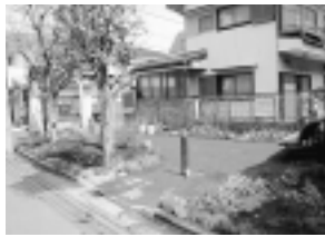
中原三丁目コミュニティガーデン

花とみどり豊かなまちづくりに向けた事業の実施 コミュニティバス運行経路等の見直し(北野ルート の試験運行) 駐輪場の整備(天文 台下駐輪場・三鷹駅 南口西駐輪場) 三鷹駅バリアフリー 化の助成 あんしん歩行エリア の整備