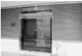
太宰治文学サロン

第3次基本計画の第2次改定 公共施設の保安・活用に向けた取り組み 統合型地理情報システム(GIS)の導入 ユビキタス・コ ミュニティ推進 基本方針に基づ く事業の推進 太宰治顕彰事業 の推進