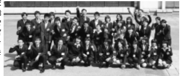
昨年度の新規採用職員

人々の価値観が多様化している今、市役所職員に求められているのは、市民のみなさんの要望を敏感に感じとり、その中から真に必要な施策を選択し、的確なサービスを提供することです。「ニーズに応える」という点においては、公務員も民間企業も変わりません。市の仕事は暮らしに密着しているだけに、政策決定や個々の事業を市民のみなさんとの協働で行うことが大切です。さまざまな人と真摯な気持ちで向き合う市の仕事に、やりがいを感じる若い仲間が入庁してくれることを期待しています。