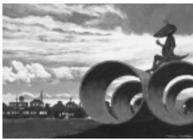
《カネゴン》成田亨 2000年 ©成田流里

一般600円、高大生300円 65歳以上、中学生以下、障害者手帳をお持ちの方は無料