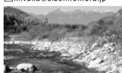
秋の千曲川とハケ岳