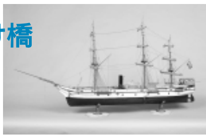
軍艦エルトゥールル号(模型)

日本とトルコの交流は100年前の明治時代までさかのぼることができます。本展では、最初のトルコ使節「軍艦エルトゥールル号」の派遣と和歌山県串本沖での遭難事件を関係資料とともに紹介します。