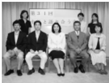
三鷹市長 清原慶子