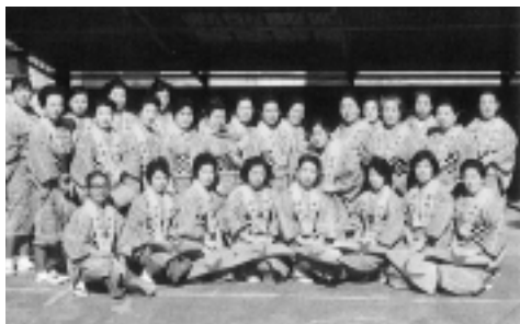
三鷹阿波踊り30周年記念誌「みたかの熱い夏」より

昭和43年、三鷹駅南口駅前の中央通り商店街が、夏のイベントとして何か変わったものを開催しようと、徳島県から「うずしお連」を招待し、三鷹駅前で総勢60人の踊り手に本場の阿波踊りを披露してもらいました。これが、三鷹阿波踊りの始めです。