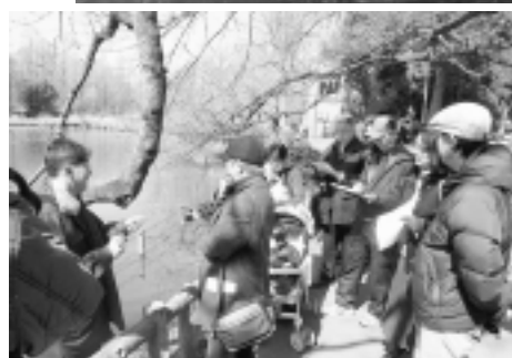
最初に被写体となる桜の木を選びます。(2006年シャッターボランティアのみなさん)

▶3月9日(金)までに、住所・氏名・電話番号・メールアドレスを同課 ☎内線 2834・✉midori@city.mitaka.tokyo.jpへご連絡ください。