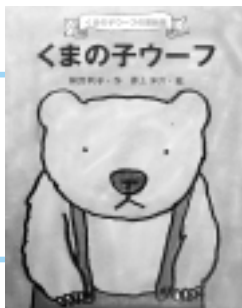
神沢利子 著 井上洋介 絵

現在約100人の市民実行委員で企画運営されている「神沢利子展プロジェクト」。そのキックオフ企画として、手づくりの展覧会が開催されます。 同プロジェクト実行委員会・市主催