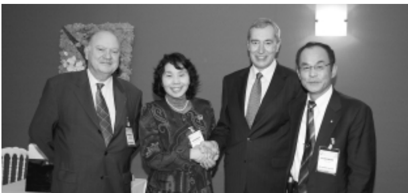
(左から)イッシー・レ・ムリノー市長、清原市長、フランス市長会会長、石井市議会議員