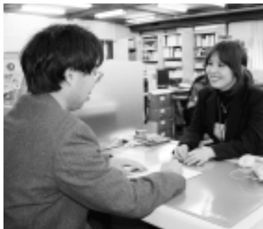
臨時納税相談窓口