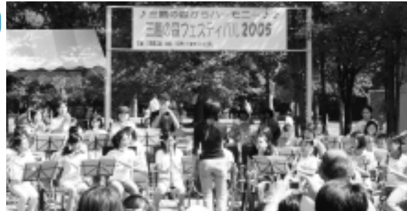
昨年は井の頭公園に四小の吹奏楽部の音色が広がりました

四小児童中心の吹奏楽、三鷹の森ジブリ美術館スタッフによるバンド演奏、スタジオジブリ第1回プロデュース作品としてリリースされた「どれどれの唄」でおなじみの拝郷メイコミニコンサートほか。