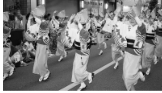
2日間で46連、延べ2,000人が三鷹の夏を「阿波踊り」で盛り上げます。

8月19日(土)・20日(日) 午後6時～9時(小雨決行) 三鷹駅南口駅前通り ☎三鷹商工会 ☎49-3111 http://awaodori.mitaka.ne.jp/