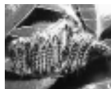
チャドクガ(毛虫)に注意！

企画経営室 ☎内線2116 チャドクガ(毛虫)に注意！ 初夏から晩夏にかけて、ツバキ類にチャドクガの幼虫が発生します。つつかり触れると激しいかゆみを引き起こしますので注意ください。