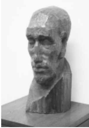
「仕事を成しえた男」小畠廣志作

5月26日、名誉市民の故鈴木平三郎氏のご遺族から木彫(写真)の寄贈を受けました。鈴木氏は第三代三鷹市長として昭和30年から5期20年に渡って市政を担当、行政運営に企業性を導入するなど行政の合理化を推進するとともに、全国初の公共下水道100%を達成し、市の発展期に大きな功績を残し、昭和55年に名誉市民に推挙されました。鈴木氏は昭和59年に亡くなられ、今年は生誕100年目にあたります。ご遺族から市に寄贈された木彫は鈴木氏をモデルに彫刻家で第6回の平樹田中賞を受賞した小畠廣志氏(故人)が「仕事を成しえた男」と題して彫った作品です。 ⇒コミュニティ文化室 ☎内線2517