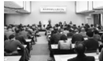
みたか自治シンポジウム

自治基本条例をテーマとした「みたか自治シンポジウム」の開催 三鷹ネットワーク大学の開講 戸籍システムの整備 絵本館（仮称）の検討と地域の担い手の育成事業の実施 大沢下原地区公会堂（大沢五丁目）の整備