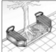
(歩道部植栽スペース設置タイプ)

「愛称は「ほっとベンチ」に決定！」 市が進める「ベンチのあるまちづくり整備事業」について、2月に実施したパブリックコメントの結果とネーミング募集の結果をお知らせします。 ベンチのネーミング(愛称)は、みなさんから寄せられたご意見を検討した結果、「ほっとベンチ」と決定しました。ほっとする、や、あたたかい(心や気持ち)などの意味合いを持ち合わせたもので、市民のみなさんに親しまれる愛称として命名しました。たくさんのご意見をいただき大変ありがとうございました。 「ほっとベンチ」のあるまちづくり整備事業の概要版と、パブリックコメントの結果については、道路交通課(市役所5階⑤番窓口)や相談・情報センター(市役所2階)、各市政窓口で配布しているほか、市のホームページにも掲載しています。