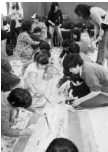
三鷹の空に架かる大きな虹が出現 (絵本制作風景)

もうすぐ、三鷹に「世界一大きな絵本」が誕生します。縦2.7×横4.7、全12ページ、背表紙とページの端をホールで綴じた巨大な手作り布絵本「キウウの青空キャンパス」は、ボールのキウウちゃんが国立天文台の屋根から落ちて、井の頭公園などを冒険するというストーリー。市内の子ともたちとボランティアの共同作品で、鮮やかな色彩が布いっぱいに広がる楽しい絵本です。