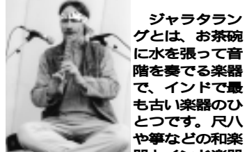
ティ・エム・ホフマン