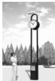
新しく設置したケヤキの木と緑の小ひろば（東側玉川上水際）の時計は、東京三鷹ライオンズクラブからご寄付いただきました。ありがとうございました。