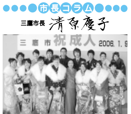
未来を担う 新成人の輝き

1月には、新春を迎えたいすがすがしい空気の中で、市にとって大切な行事が多くあります。 9日には、「成人を祝福すること」を市と教育委員会、選挙管理委員会の主催で、新成人を中心とした実行委員会の企画運営で開催しました。当日は、300人を超える新成人が参加され、会場の公会堂ホールは熱気に包まれました。 私は成人を迎えられたことを祝福し、この20年間の社会変動や技術革新の大きな中で、新成人の皆さんの尊い命が「両親の愛情」から生まれ、育まれてきたことの大切さ、これまでの人生が学校の先生や友人、地域や職場の皆さんによって支えられていることに「感謝する」との意義、そして「新成人として社会の中でそれぞれが役割をはじめとする社会的責任」を果たしていくことの重要性についてお話をしました。 会場の皆さんは熱心に耳を傾けて聞いてくださり、大きな拍手をいただいたに感謝しました。