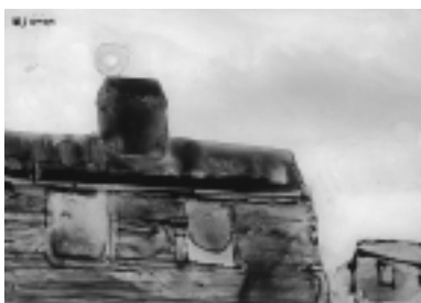
清宮寛文《虜囚の窓》1971年 12.1×17.2cm

展覧会場で自由な感覚でゆっくりと作品を感じ、心ゆくまで絵や色に浸ってください。いろいろな見方のヒントやイベントを用意してお待ちしています。