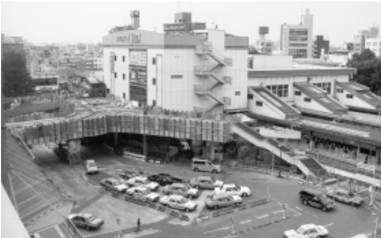
工事が進む三鷹駅前広場

市では、このたび「三鷹駅前地区再開発基本計画」を改定しました。平成8年3月に策定した旧計画は、三鷹駅前地区の整備に大きな成果をあげてきており、現在、平成18年3月の完成をめざして進んでいる三鷹駅南口駅前広場第2期整備工事もその1つです。今回の改定は、個別事業が進んできたこと、この9年間で駅前の環境が大きく変化したことなどを受けて行ったものです。