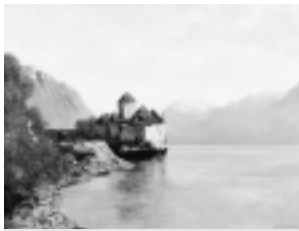
《シヨン城》 1874年 86×100cm 油彩

期間 4月16日(土)～6月5日(日) 開館時間 午前10時～午後8時(入館は7時30分まで) 休館日 月曜日 観覧料 一般800円、学生(中・高・大)500円 65歳以上、小学生以下と障がい者の方は無料。 写実主義の代表的画家とされるギュスターヴ・クールベは、1819年フランス北東部のオルナンに生まれました。19世紀半ば、絵画は歴史上の人物や出来事を題材にしたものが主流でしたが、クールベはあるがままの風景や人物を描き、当時の画壇に物議を醸しました。しかし、風景画を中心に徐々に評価は高まり、その後の印象派の画家達に大きな影響を与えました。 本展では、オルナンの生家をそのまま美術館としたクールベ美術館が所蔵する油彩、ペーパーワーク、資料、周辺の画家の作品など約70点をご紹介します。 この記事を切り抜いて展覧会にお持ちください。 1回に限り2人まで一般入場料800円を640円に割引きます。