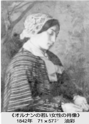
《オルナンの若い女性の肖像》 1842年 71×57cm 油彩