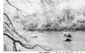
実際に桜が咲くとこんな感じに...

をしているもう1本の桜のある場所へ。移動中、「お茶屋さん新築されてる!」などと新しい発見をする日暮さんと見見さん。こうした発見が新鮮な情報提供の源なのでしょう。桜の方ですが、この日はまだ咲いていませんでした。残念。