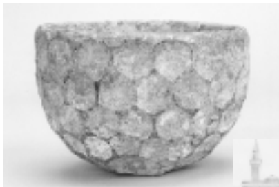
カット装飾碗 ガラス イラン 6世紀 径11.5cm