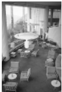
ラウンジからは箱根の山並みが一望できます

1室を1人でご利用の場合は、2,000円増しです。3歳未満の方で寝具を必要とするときは、宿泊料として1人1,200円(市外の方は2,100円)を申込時にお支払いください。入湯税、特別料理などの料金は保養所でお支払いください。年末年始(12月31日～1月3日)は、大人の方のみ1人1,000円増しとなります。市外の方のみの使用はできません。