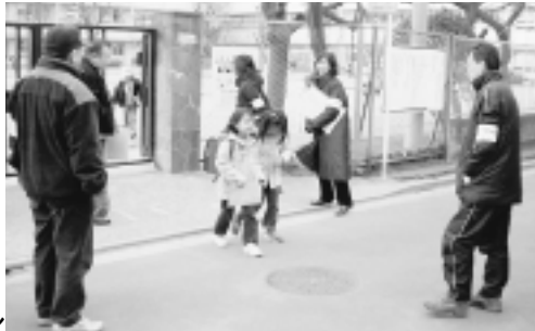
市民による安全安心パトロール

市民の安全を守る施策のさらなる強化に取り組みます。地域環境の改善に、防犯の視点であたるとともに防災対応も推進します。また、公共施設の環境対策を徹底して行います。