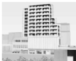
ネットワーク大学が入る三鷹駅南口第12地区協同ビル

コミュニティセンター、地区公会堂の当初整備目標を完了、新展開への調査を開始します。「あすのまち・三鷹」プロジェクトの成果を検証、三鷹ネットワーク大学[インキュベート施設](仮称)に継承します。「自治基本条例(仮称)」の普及・啓発を図ります。また、引き続き市民協働のまちづくりを推進します。