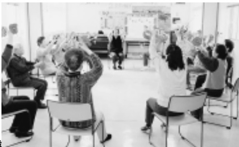
介護予防健康づくり事業

高齢者、障がい者など、市民が地域で暮らし続けていける施策を行うとともに、緊急時の保護体制を強化します。介護施設の充実や、障がい者の自立にも取り組みます。