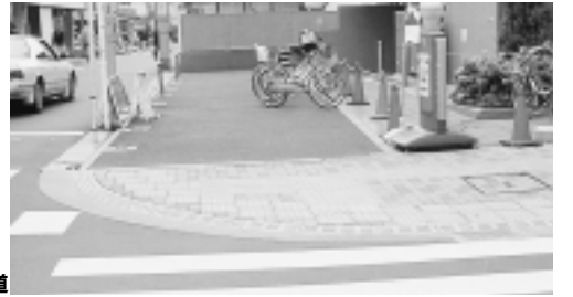
バリアフリー化された歩道

誰もが過ごしやすいように細やかな心配りでの施設改善を継続し、「心のバリアフリー」、「情報バリアフリー」も推進します。