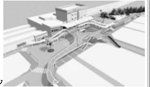
三鷹駅前広場の完成イメージ