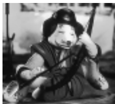
「おこんじょうり」 ©(株)映映画社・エコー社

上映作品 「こぶとり」(1958年日本21分)、「おこんじょうり」(1982年日本26分)、「結んだハンカチ」(1958年チェコスロバキア15分)、「シュツ・シュツ」(1972年カナダ14分)