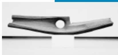
江口週 「死者のふね」1961年