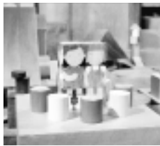
「シュツ・シュツ」