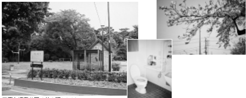
三鷹台児童公園(井の頭1-3-6)