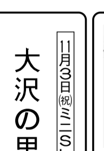
ユーリー・ノルシュテイン

1942年カザフスタン生まれ。ノルシュテイン映画の美術監督。ノルシュテインの映画は、キャラクターの表情ひとつひとつでも忘れがたく、緻密な描写でキャラクターと背景が見事に融和し、写実的な一方、幻想的で不思議な夢を見ているかのような気分に分される。そうした魅力ある絵