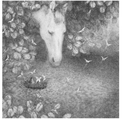
「霧の中のハリネズミ」

と「上映終了後8時30分」当日は、午後4時から入場し、展示作品を見ることが出来ます。6時30分以降の入場は抽選でさせていただきます。