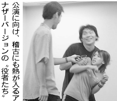
公演に向け、稽古にも熱が入るアナザーバージョンの「役者たち」